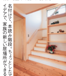
名付けて、本読み階段。ちよとしたアイデアで、家族の新しい居場所ができる