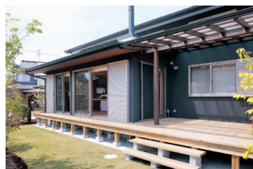
軒を伸ばし、射し込む太陽光をコントロール。サービスマード部分はポリカーボネートの屋根で、明るさを確保