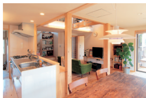
リビング・ダイニングと連続するキッチンからは、吹き抜けを介して2階の子どもの様子も把握できる