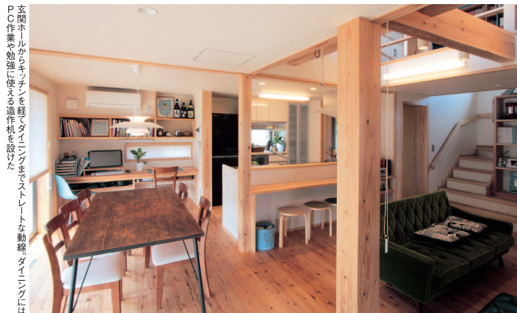
玄関ホールからキッチンを経てダイニングまでストレートな動線。ダイニングにはPC作業や勉強に使える造作机を設けた

「家遊び」を楽しむ 機能的で快適な空間 S邸のテーマは、「家遊び」を楽しむ。ゆったりと確保したリビングダイニングには、ハイサイドライトから明るく気持ちの良い自然光が注ぐ吹き抜けになっていて、子ども部屋、キッチン、主寝室をつないでいる。薪ストーブ横から出入りできるウッドデッキは、庭や菜園と連続する形で設けられ、サービスマードとして使われるほか、ご主人のDIYの趣味スペースにもなる。すでに完成している、畑横の薪置き場や、ダイニングのテーブルは、ご主人、家族の共同作業でできたものだ。