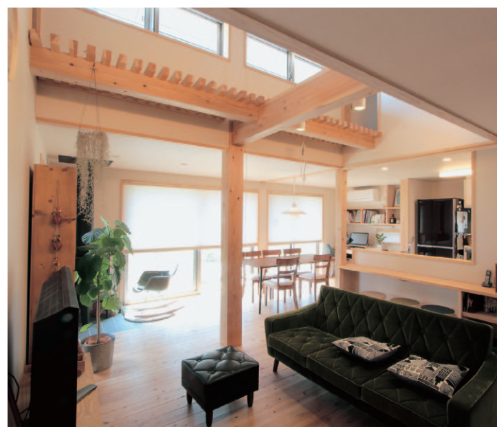
家の中心に位置するリビングにも、吹き抜けのハイサイドライトから自然光が注ぐ。日中は照明いらず